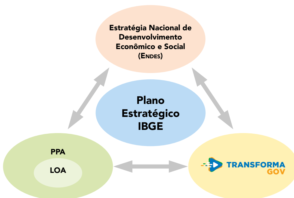
Figura 1 - Alinhamento do Plano Estratégico do IBGE com a Endes, com o PPA e com o TransformaGov

Assim, no último trimestre de 2021, o Plano Estratégico do IBGE foi revisado e atualizado, foram construídos indicadores e definidas as respectivas metas. Além disso, foi promovido alinhamento das estratégias organizacionais às diretrizes da Estratégia Nacional de Desenvolvimento Econômico e Social (Endes) para o Brasil (2020 a 2031), aos programas do PPA 2020-2023; e aos requisitos do Programa de Gestão Estratégica e Transformação do Estado – TransformaGov, instituído pelo Decreto nº 10.382, de 28 de maio de 2020, conforme ilustrado na figura a seguir.